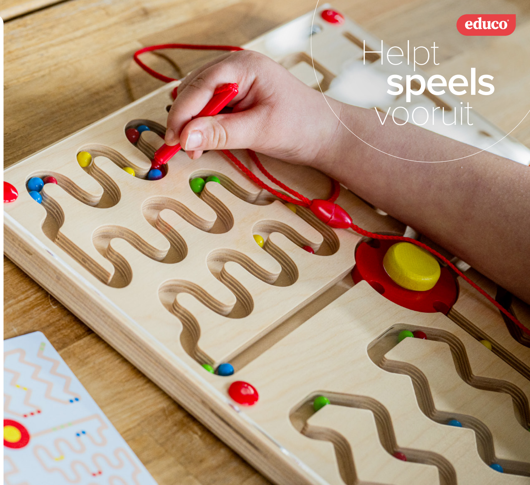
Tableau de motricité - tracés 2