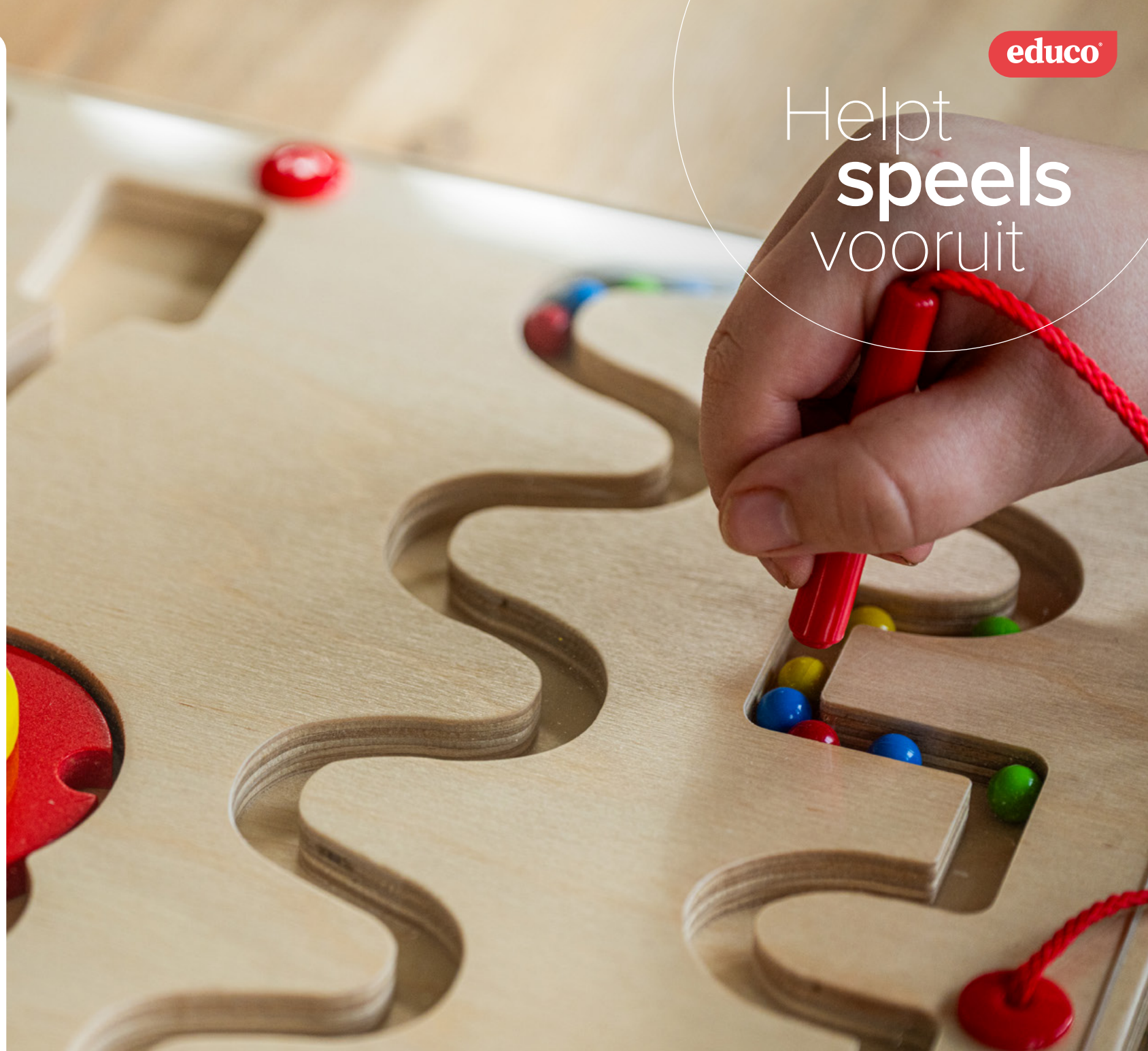
Tableau de motricité - tracés 1