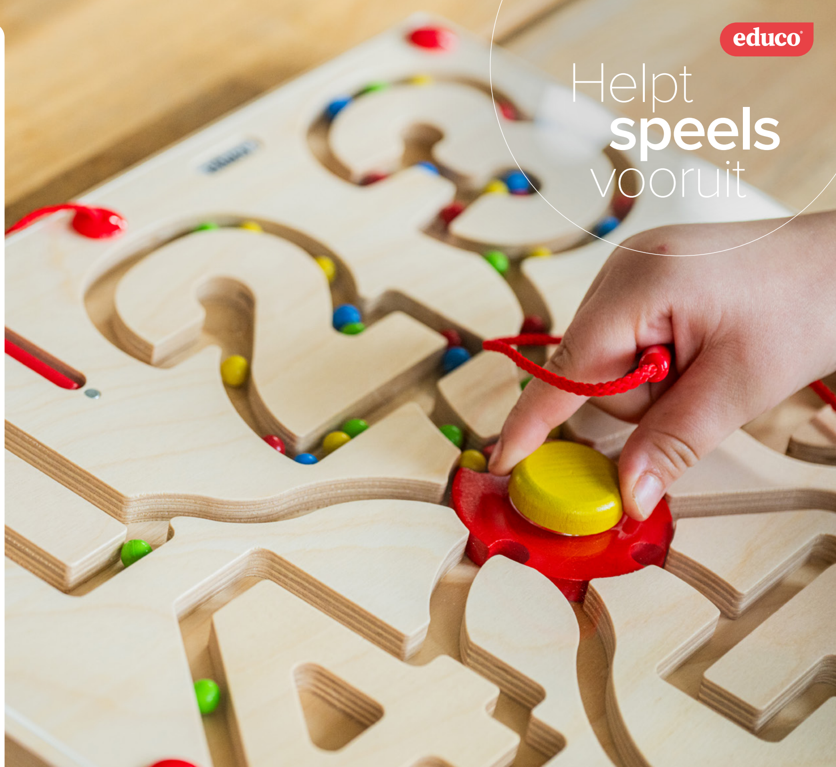
Tableau de motricité - chiffres jusqu'à 8